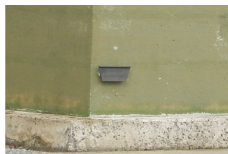
Zoom sur le repère de crue. Prise de vue : Septembre 2014