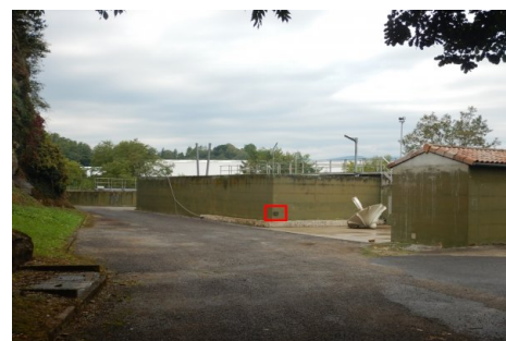
Localisation du repère - vue d'ensemble. Prise de vue : Septembre 2014 - Ardèche Claire