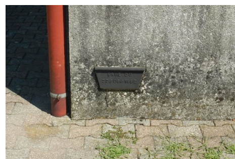
Zoom sur le repère de crue. Prise de vue : Août 2014 - Ardèche Claire