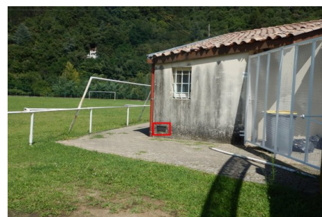
Localisation du repère - vue d'ensemble. Prise de vue : Août 2014 - Ardèche Claire