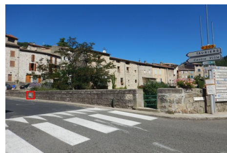
Localisation du repère - vue d'ensemble. Prise de vue : Septembre 2014 - Ardèche Claire