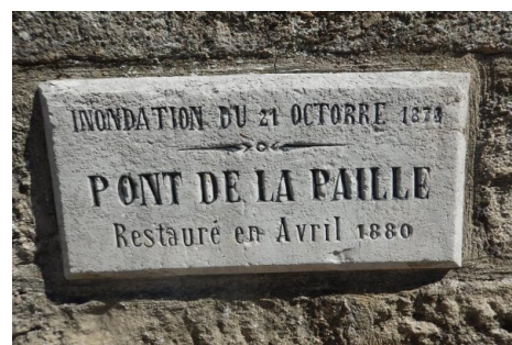
Zoom sur le repère de crue. Prise de vue : Septembre 2014 - Ardèche Claire