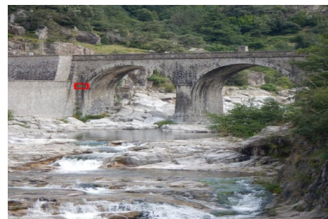
Localisation du repère - vue d'ensemble. Prise de vue : Août 2014 - Ardèche Claire