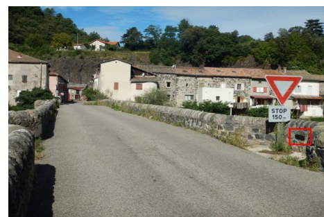
Localisation du repère - vue d'ensemble. Prise de vue : Août 2014 - EPTB Ardèche