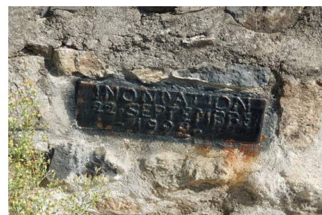
Zoom sur le repère de crue. Prise de vue : Août 2014 - EPTB Ardèche