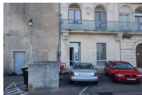
Localisation du repère - vue d'ensemble. Prise de vue : Août 2014 - Ardèche Claire