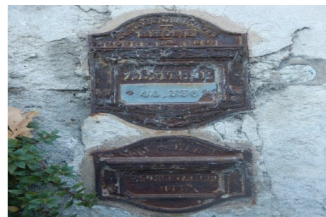
Zoom sur le repère de crue. Prise de vue : Août 2014 - Ardèche Claire