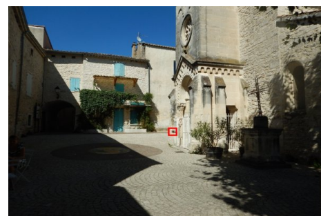
Localisation du repère - vue d'ensemble. Prise de vue : Août 2014 - Ardèche Claire