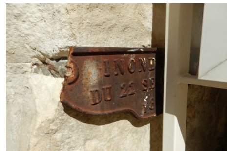
Zoom sur le repère de crue. Prise de vue : Août 2014 - Ardèche Claire