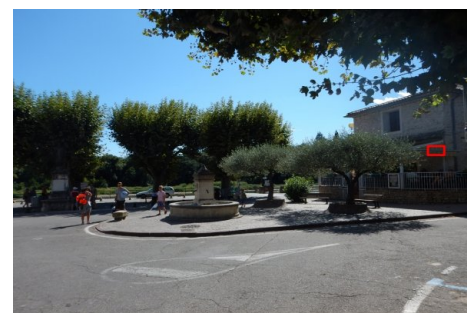
Localisation du repère - vue d'ensemble. Prise de vue : Août 2014 - Ardèche Claire