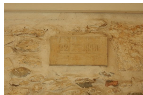
Zoom sur le repère de crue. Prise de vue : Août 2014 - Ardèche Claire