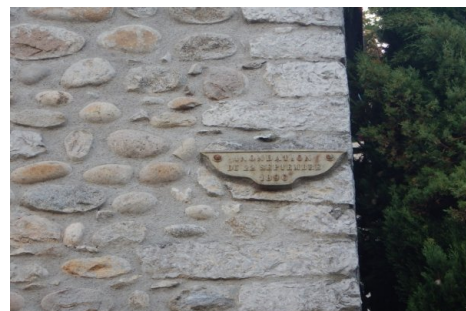
Zoom sur le repère de crue. Prise de vue : Août 2014 - Ardèche Claire