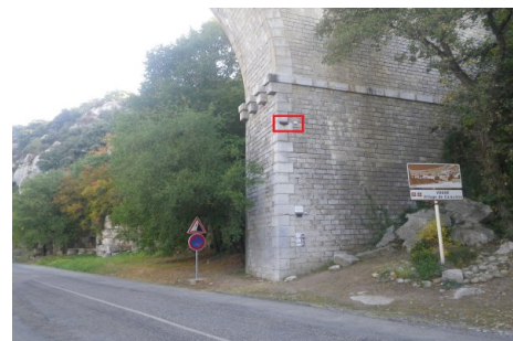
Localisation du repère - vue d'ensemble. Prise de vue : Septembre 2017 - Ardèche Claire