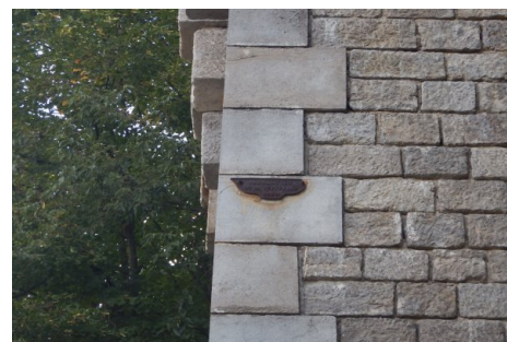
Zoom sur le repère de crue. Prise de vue : Août 2014 - Ardèche Claire