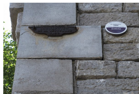
Zoom sur le repère de crue. Prise de vue : Août 2014 - EPTB Ardèche