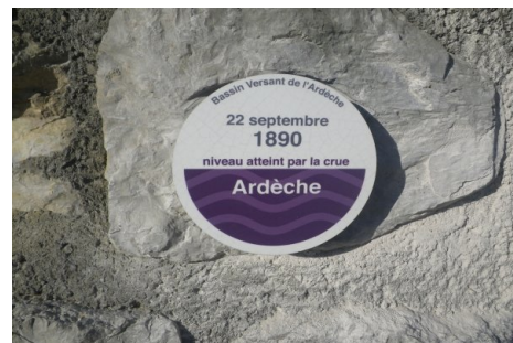
Zoom sur le repère de crue.

Prise de vue : Septembre 2017 - EPTB Ardèche