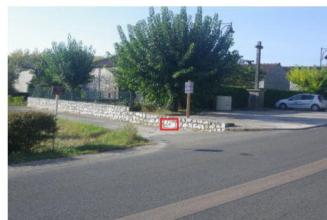
Localisation du repère - vue d'ensemble.

Prise de vue : Septembre 2017 - EPTB Ardèche