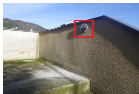
Zoom sur le repère de crue. Prise de vue : Décembre 2018 - EPTB Ardèche