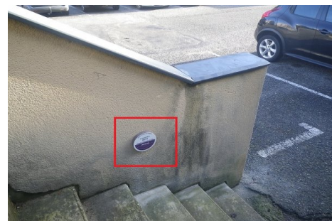
Zoom sur le repère de crue. Prise de vue : Décembre 2018 - EPTB Ardèche