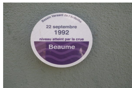
Zoom sur le repère de crue.

Prise de vue : Septembre 2018 - EPTB Ardèche