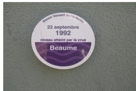
Zoom sur le repère de crue. Prise de vue : Septembre 2018 - EPTB Ardèche