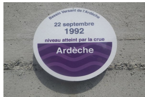
Zoom sur le repère de crue. Prise de vue : Septembre 2018 - EPTB Ardèche