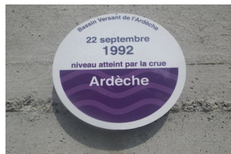
Zoom sur le repère de crue.

Septembre 2018