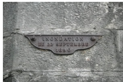
Zoom sur le repère de crue. Prise de vue : Septembre 2014 - Ardèche Claire