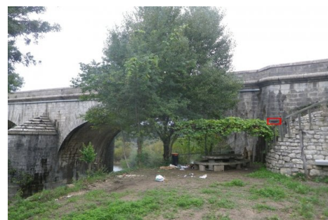
Localisation du repère - vue d'ensemble. Prise de vue : Septembre 2014 - Ardèche Claire